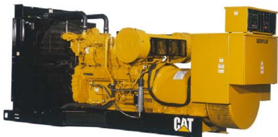
Генераторная установка показана с оборудованием, устанавливаемым по специальному заказу